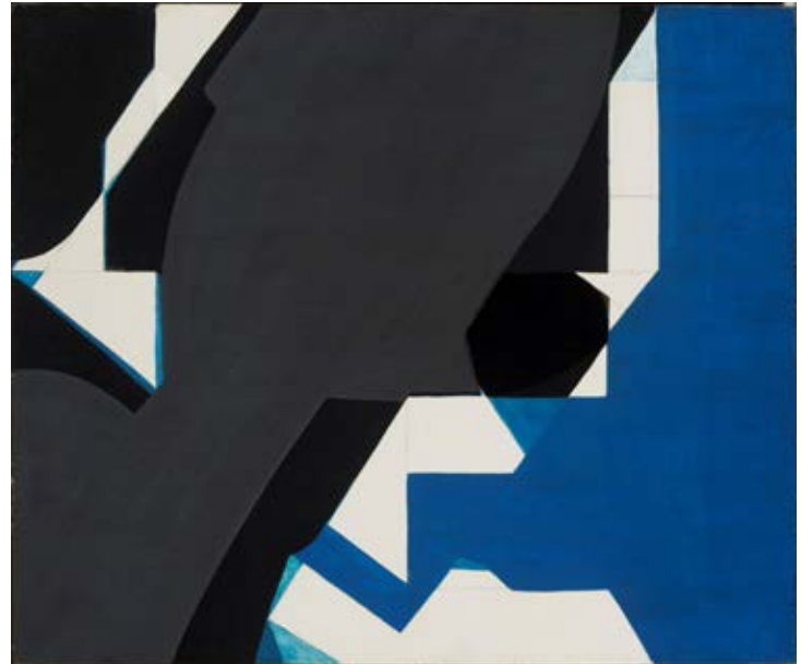
Jakob Weidemann, Detalj / Detail , 1957, 46 x 55 cm, olje på lerret / oil on canvas. KODE Kunstmuseer og komponisthjem. Nicolai Tangen, London

In the late 1960s Weidemann exchanges the tempera technique for oil on canvas, continuing with it for the rest of his life. In 1973 he is the featured exhibitor for Bergen International Festival (for the second time). There he presents the exhibition In Light of the Coltsfoot , which gives him the opportunity to develop the theme that will occupy him for the rest of his career: nature and the flowers' constant tilting towards light. His visual