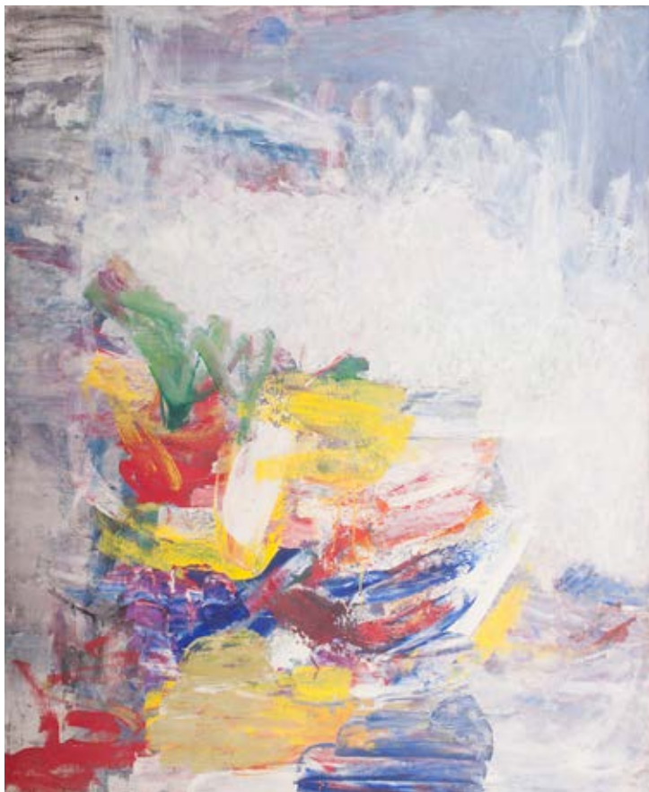
Jakob Weidemann, Hestehov / Coltsfoot , 1965, 110 x 90 cm, olje og tempera på lerret / oil and tempera on canvas. Privat eie / Private collection

Norwegian colleagues such as Inger Sitter, Odd Tandberg and Gunnar S. Gundersen, all are executed in an abstract visual language. Weidemann is seen as an important pioneer in this area. Gunnar S. Gundersen describes him as a 'courtyard tree' in Norwegian art, thus emphasizing his position as a solid source of inspiration through several decades.