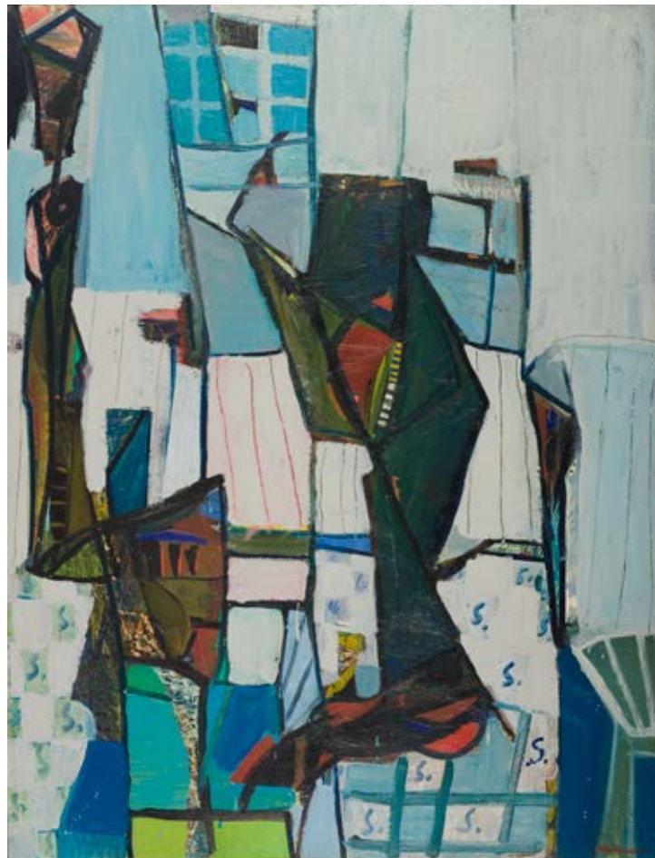
Jakob Weidemann, 2 i badet / 2 in the bath , 1947, 116 x 89 cm, olje på plate / oil on wooden board. Munchmuseet, Rolf E. Stenersens gave til Oslo by