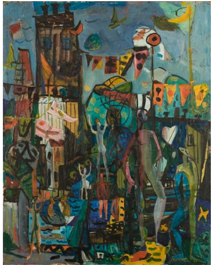
Jakob Weidemann, Flagging. Frigjøring / Flags. Emancipation , 1946, 92 x 73 cm, olje på lerret / oil on canvas. Munchmuseet, Rolf E. Stenersens gave til Oslo by