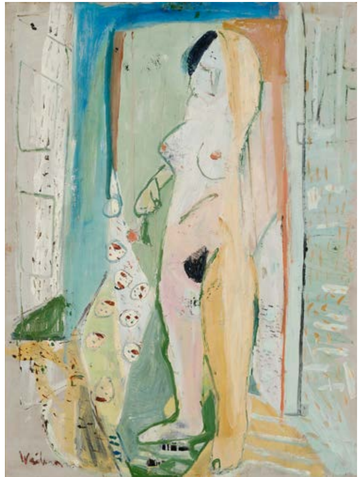
Jakob Weidemann, Akt / Nude , 1942, 79,5 x 59,5 cm, olje på plate / oil on wooden board. Lillehammer Kunstmuseum

I utstillingen viste han bilder som spenner vidt i forhold til både formspråk og uttrykk, fra fabulerende og surrealistisk inspirerte komposisjoner til fargesprakende arbeider i et geometrisk-abstrakt formspråk. I bildene